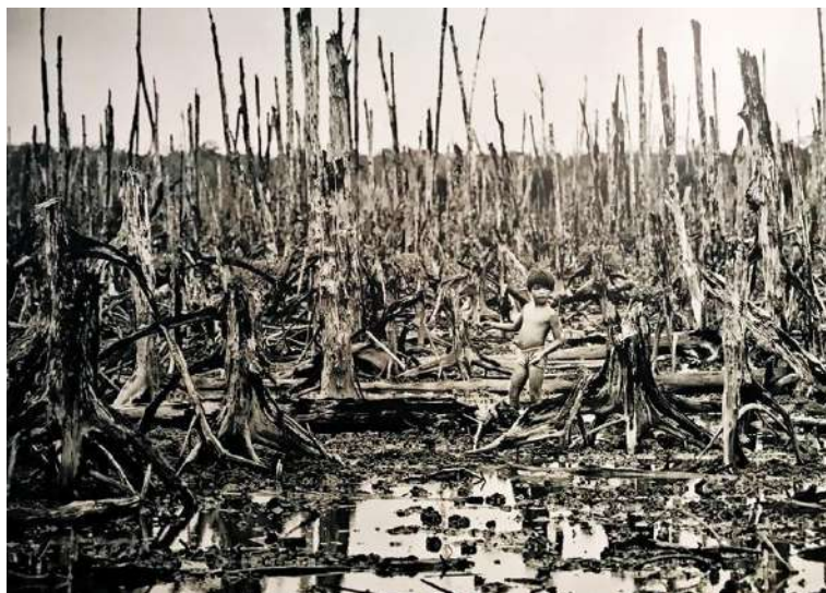
Épandage d'agent orange au Viêt Nam et effets sur le paysage (années 1960)